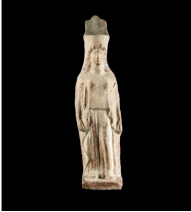
Demèter. Deessa grega de l'agricultura, segle v aC. Museu de l'Empordà, Figueres. mE 306.