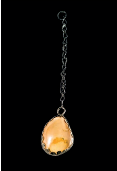
Penjoll d'àgata. Amulet, Catalunya, probablement segle XIX. Museu Etnològic i de Cultures del Món. Ajuntament de Barcelona. MEB 414-182