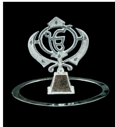
Khanda i Chakram. Objectes d'ús ritual a les celebracions sikh, segle XXI. Comunitat Sikh d'Olot.