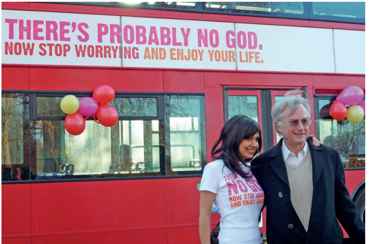
Campanya atea.