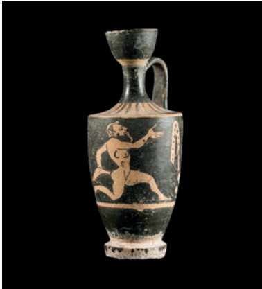
Lèkythos. Contenidor d'olis d'ús funerari, 480-400 a.C. Museu de l'Empordà, Figueres. mE 299.

Per què ho diem, tot això? Senzillament, per mostrar que les religions van molt més enllà de ser un recull de creences i una forma organitzativa. Són, principalment, un dels més importants repositoris de la saviesa de la humanitat. Gràcies a les religions sabem com vivien, com estimaven, com es relacionaven, com treballaven, com somniaven, com lluitaven, com morien els nostres avantpassats. «Com», i «per què». I no els nostres avantpassats recents, sinó des de fa mil·lennis. I tot aquest coneixement, recollit en textos, en pràctiques, en memòria oral, en l'art, avui encara ens és útil per viure, estimar, relacionar-nos, treballar, somniar, lluitar o morir. Perquè la saviesa és això: és saber viure. Durant mil·lennis, els humans hem anat construint, triant, creant, descartant, polint, tot un coneixement que ens serveix per viure amb sentit. I sobretot ho hem fet a l'ombra de l'arbre de la religió. Les religions, a més, s'han anat influïnt les unes a les altres, de manera que en les religions actuals podem trobar-hi saviesa procedent de pobles i religions que avui ens són gairebé desconegudes. I, en tant que acumulen la saviesa de la història, són un patrimoni de tota la humanitat, no només dels seus membres, creients o practicants. Són un dels grans patrimonis immaterials que tenim, i tots els humans ens n'hem de fer responsables.