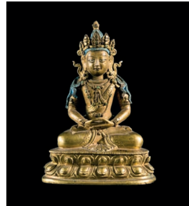
Buda Amitayus. Segona meitat s. XVIII. Biblioteca Museu Víctor Balaguer, Vilanova i la Geltrú. BMVB-3890.