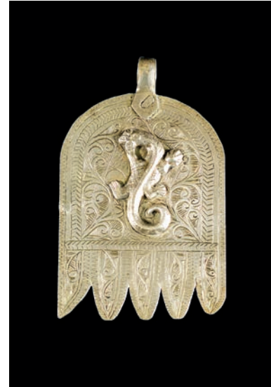
Khamisa. Mà de Fàtima. Amulet, Marroc, segle xx. Museu Etnològic i de Cultures del Món. Ajuntament de Barcelona. MEB 22-202.

La gran paradoxa (als humans ens encanten, les paradoxes!) és que això de «creure», tradicionalment, no ha tingut gaire bona premsa. Malgrat que creure ens faci humans, i malgrat que les creences ens ajudin a viure, als humans no ens agrada acceptar que creiem. Preferim dir que sabem, que sembla que vesteix més. I així, durant segles, hem estat pensant que sabíem molt, quan simplement crèiem. Sabíem que la Terra era plana, sabíem que certs ritus tenien el poder de modificar els elements de la natura, sabíem de l'existència d'un gran nombre d'éssers (avui en diríem mitològics) que ningú no havia vist mai. Però encara passa avui: sabem que un producte cura una malaltia, sabem predir el temps,