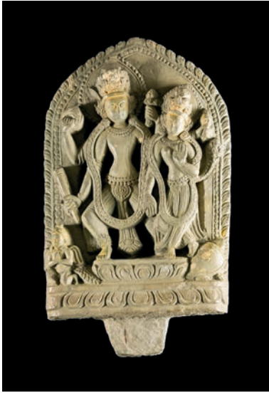
Estela de Visnu i Lakshmi. Nepal, segles XVIII - XIX. Museu Etnològic i de Cultures del Món. Ajuntament de Barcelona. MEB 113-795.