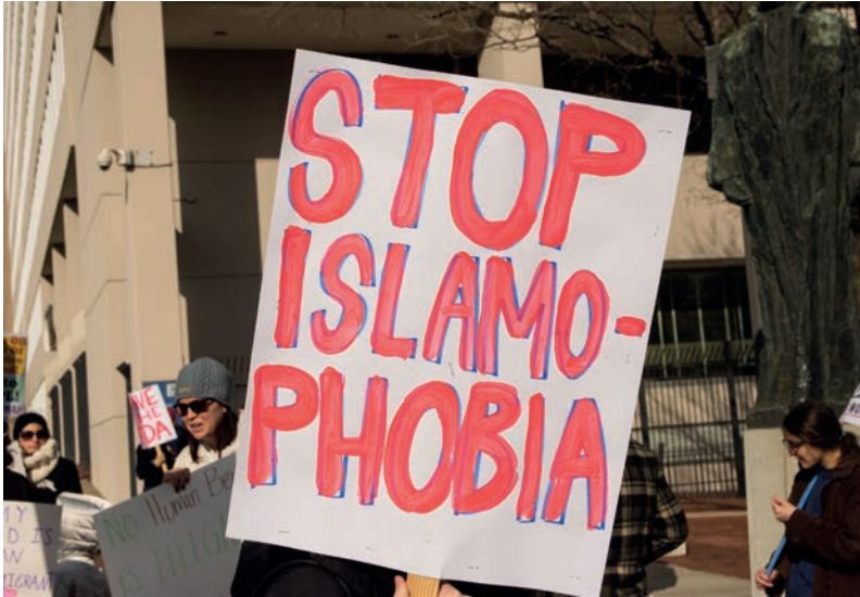
Justícia social.