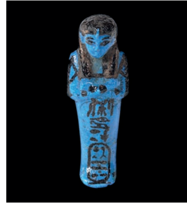
Hent-Tany. Uixebti egipci, Ca 1085-935 aC. Biblioteca Museu Víctor Balaguer, Vilanova i la Geltrú. BMVB-3870.